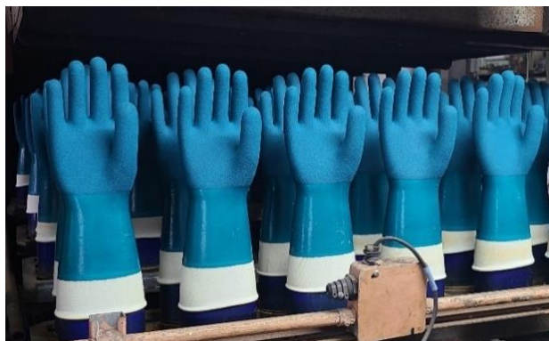
「マイクロフィニッシュ」採用第1号「ニュートワロン」製造の様子

「マイクロフィニッシュ」加工とは、手袋のグリップ性能を独自の視点から追及して開発した東和独自のスベリ止め加工です。当社は、1999年発売の「ニュートワロン」での採用以降、「マイクロフィニッシュ」加工を施した作業用手袋を多数発売してきました。最新の商品では、2024年11月にも防寒に特化した作業用手袋「ActivGrip 566 Thermo（アクティブグリップ 566 サーモ）」を発売するなど、現在もこの加工技術を施した新商品の開発が続けられています。その数は、20周年だった2019年以降の5年間で10種類超、1999年まで遡ると、全100種類超の商品が発売されています。