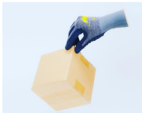
「マイクロフィニッシュ」採用の手袋はピタッと吸着してしっかり掴めます

「マイクロフィニッシュ」紹介動画：高いスベリ止め効果を YouTube 内の動画でご紹介しています。